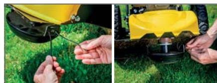
Changement du fil facile et sans outil